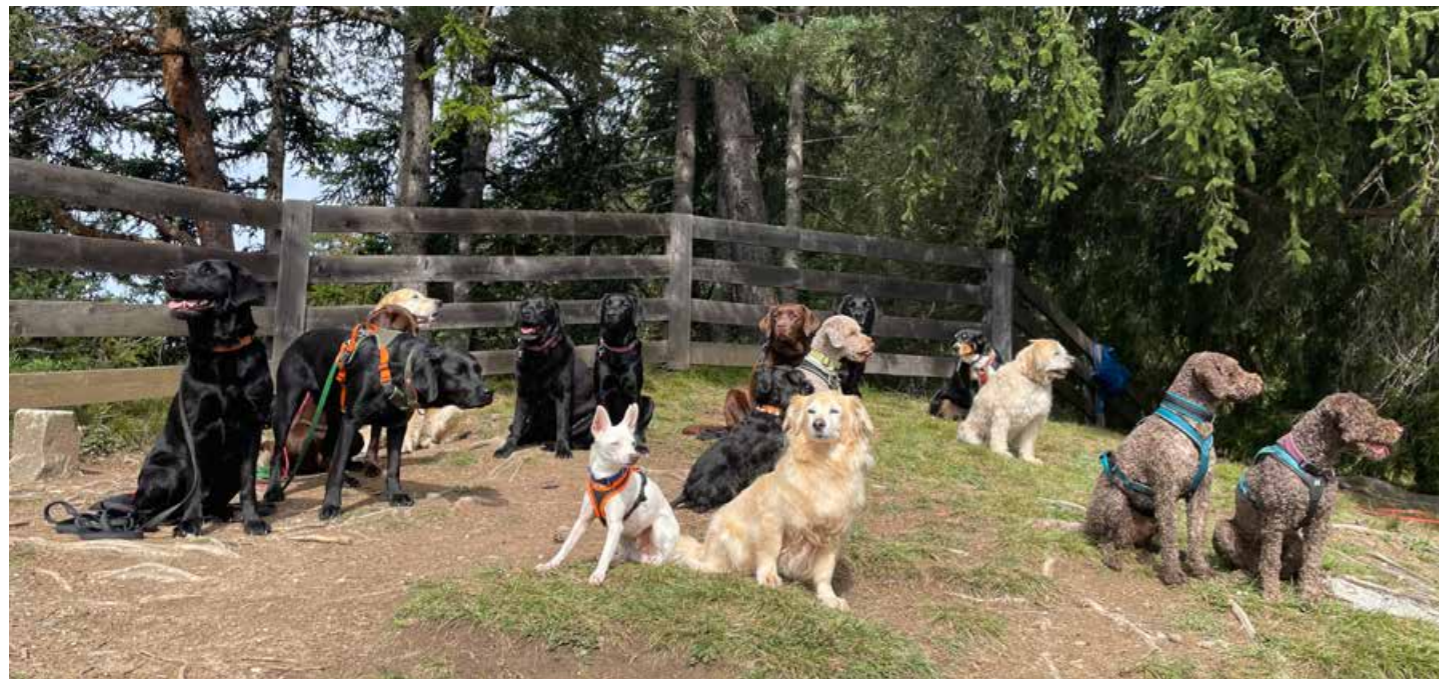
Gruppenfoto HSR Weekend