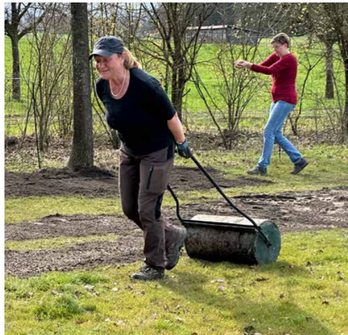
Schwerstarbeit am Arbeitstag